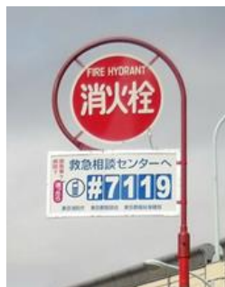
消火栓標識広告板