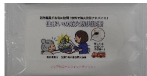
ウェットティッシュ