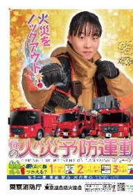
春の火災予防運動